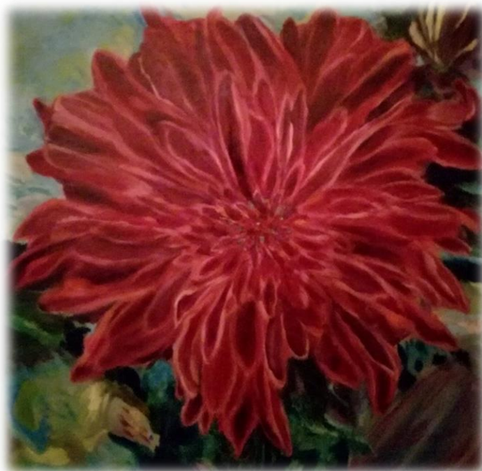
Eliza Faulhammer ~ Flammenblume