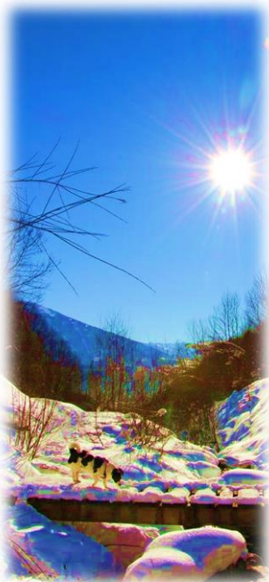
Apachy \ Hötting